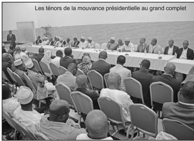
Les ténors de la mouvance présidentielle au grand complet