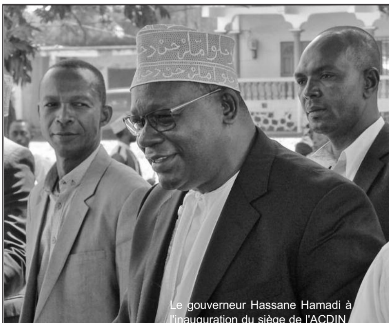
Le gouverneur Hassane Hamadi à l'inauguration du siège de l'ACDIN